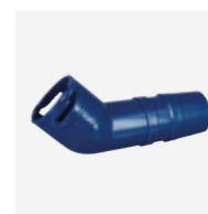
Coude 45° allongé rotatif