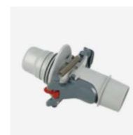
Vanne de réglage automatique de débit (skimmer)