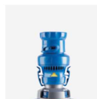
Régulateur de débit (robot)