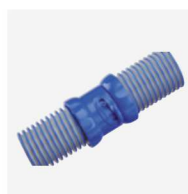
Tuyaux Twist Lock