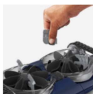
Brosses de nettoyage cyclonique