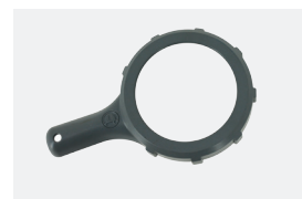
Clé desserrage cellule