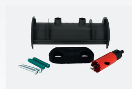
Kit d'installation de la cellule