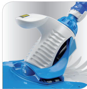
Son design compact intègre une poignée ergonomique pour faciliter sa mise à l'eau et sa sortie.

DUO TRACTION CONTROL Il aspire dans les moindres recoins grâce à son système de déplacement breveté : «Duo Traction Control». Deux disques souples et indépendants qui permettent plus de mobilité et d'adhérence dans les angles comme sur les parois, pour un nettoyage minutieux.