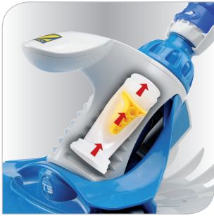
Diaphragme Dia Cyclone breveté une aspiration efficace durablement.