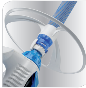
Équipés d'une roue anti-blocage, ils déjouent tous les pièges : escaliers, angles, échelles, bonde de fond.