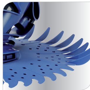
Disque à ailerons pour un déplacement dans tous les recoins de la piscine.