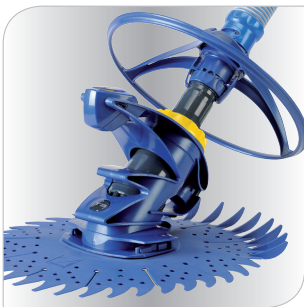
Design compact et résistant.